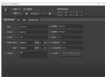
パソコン管理画面