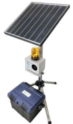
型式 VTS-SBB-12 (80Ah) (VTS-SBB-11 (14Ah))