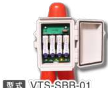
型式 VTS-SBB-01 (単一 VTS-SBB-02)