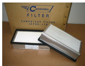
HEPAフィルター (ケンブリッジフィルター製 全数検査・合格品)