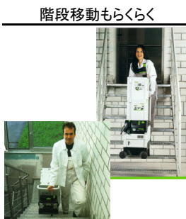
階段移動もらくらく