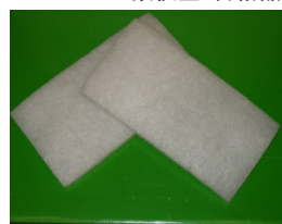
プレフィルター (HEPAフィルターを保護します)