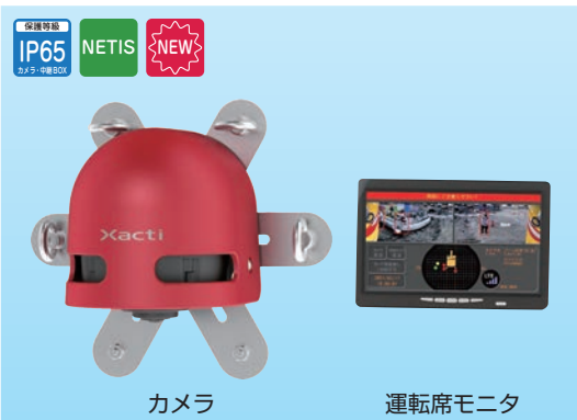
カメラ 運転席モニタ