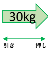
つっぱり棒は 30kg までの水平荷重に耐えられます！