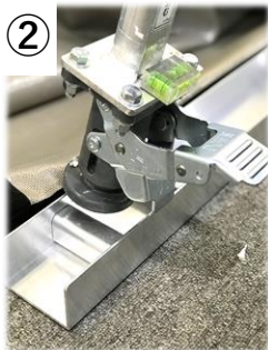
② 下部レールに つっぱり棒を設置する