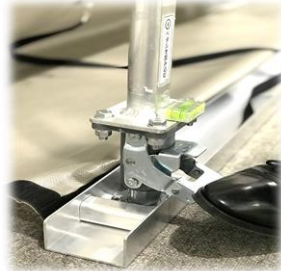
つっぱり棒は 水平器付き！ 垂直に組み立てやすい！