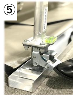
⑤ つっぱり棒が垂直に 立っていることを確認し ペダルロックを踏み込む