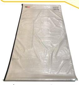
マジックシャッター1800 +上下レールL1800