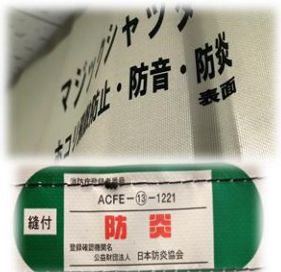
シートは 防音・防炎・採光性能 を有しています！ 仮設工業会認定品のシート素材を採用！