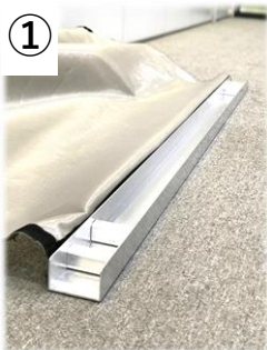
① シートの下部 レールを床に設置する