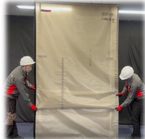
シートの伸縮はマジックテープを用いて簡単に調整できます！