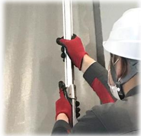
天井高 1,936mm~3,450mm まで対応！