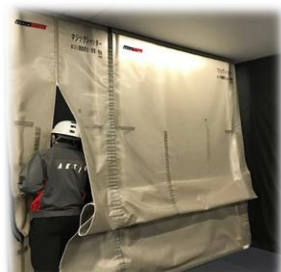
マジックシャッター900はファスナー付き！ 出入口に便利です！ 90度に曲げて コーナー としても利用可能！