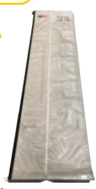
マジックシャッター900 +上下レールL900