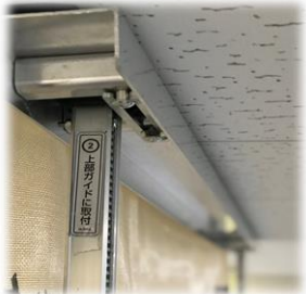
上下レールが床・天井との隙間を塞ぎ、 気密性を高めます！