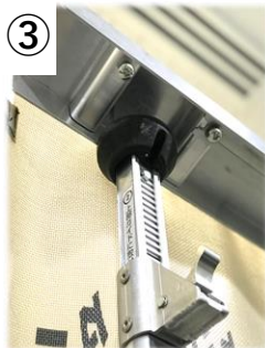
③ 上部レールに つっぱり棒を設置する