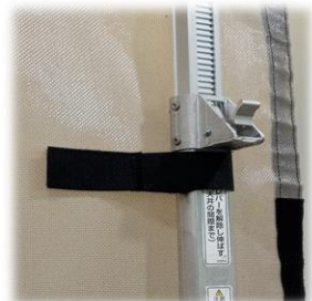
ポールをバンドで固定しシートの ばたつきを抑えます！