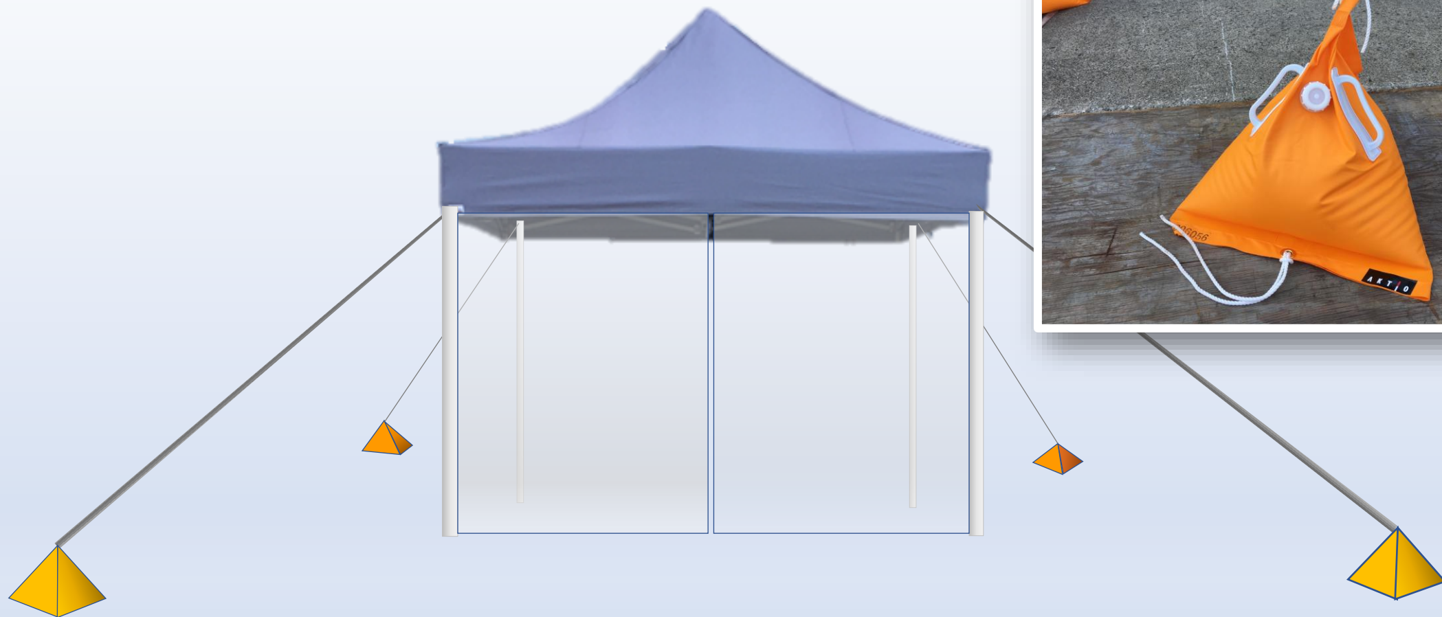
冷える一む使用例