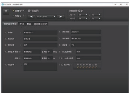
パソコン管理画面