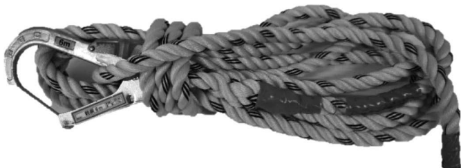
PE7 00002 001 (緊張器 ロックマン)