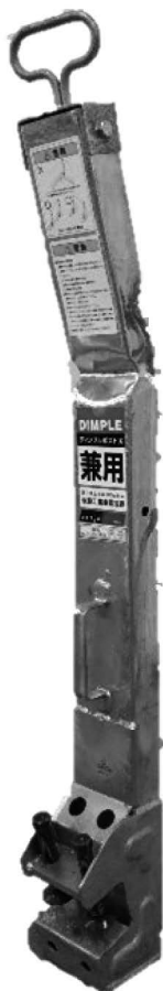
PE7 00003 001 (親綱支柱)