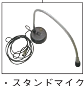
・スタンドマイク

子機側 ・子機本体×4 HX834 ・PTTケーブル×4 ・ヘッドセット×4 (ヘルメットクリップ付)