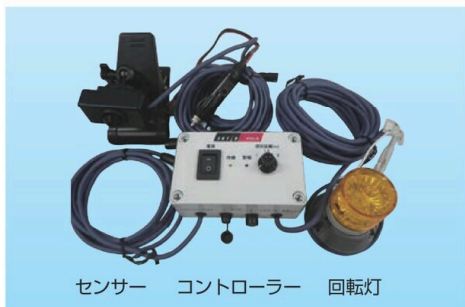
センサー コントローラー 回転灯