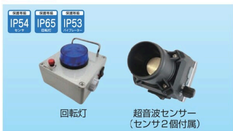
回転灯 超音波センサー (センサ2個付属)