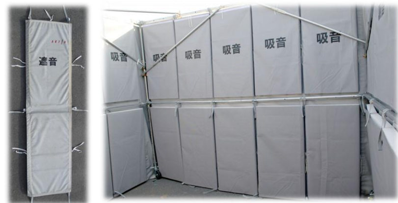
【吸音材 発泡ポリプロピレン】