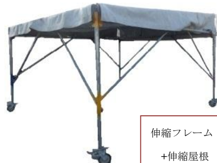
伸縮フレーム +伸縮屋根 +屋根シート 3400