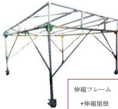
伸縮フレーム +伸縮屋根