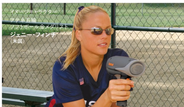
イター・キャラクター アテナ五輪 ソフトボール金メダリスト ジェニー・フィンチ (米国)