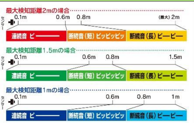
パノ라마HL センサー検知範囲