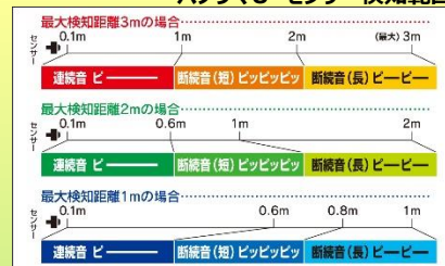
パノ라마U センサー検知範囲