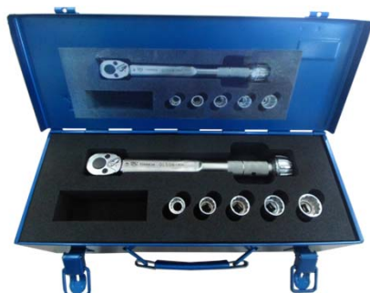
※本体同梱タイプはQL200Nまで