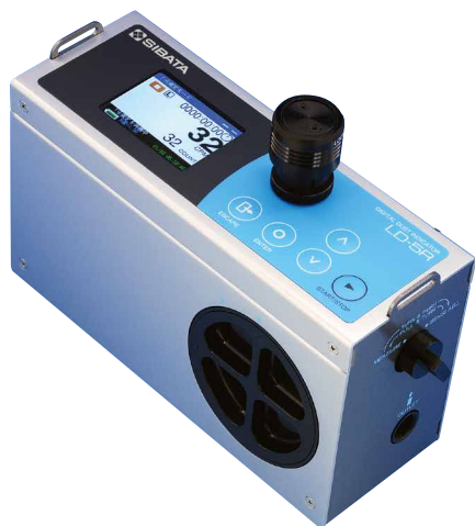
デジタル粉じん計 LD-5R型