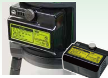
リチウムイオン充電電池(LTB-4) 重さ: 148g