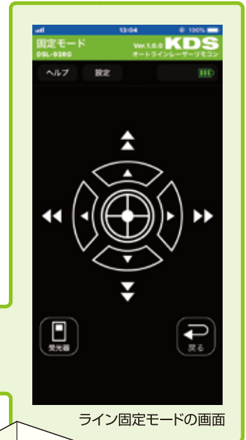
ライン固定モードの画面