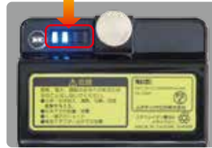
インジケーター付