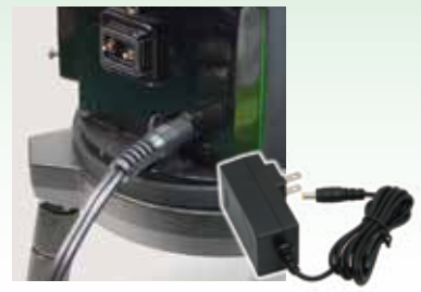
充電器兼ACアダプター(LBC-4) 重さ: 110g