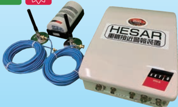
LED 警報表示器・外部アンテナ HESAR 本体