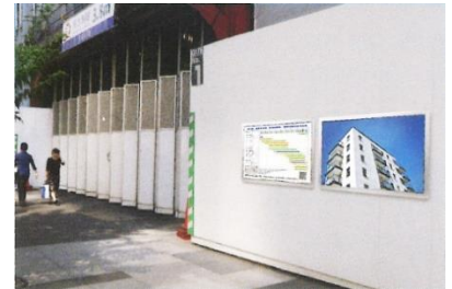
仮囲い設置イメージ