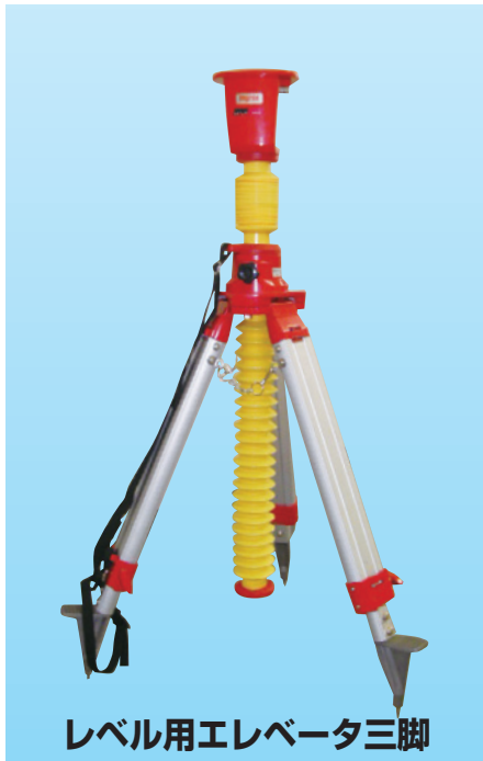
レベル用エレベータ三脚