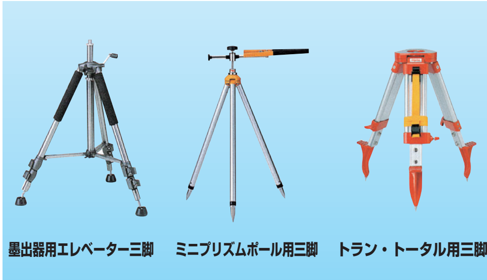
墨出器用エレベーター三脚