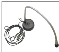
・スタンドマイク